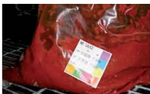
Einfache & wirkungsvolle Lebensmittelsicherheits- Etiketten

DateRight-Peel Etiketten sind kälteresistent und lassen sich rückstandslos wieder entfernen. Der speziell entwickelte Akrylkleber ermöglicht eine feste Haftung des Etiketts, lässt sich aber in Verbindung mit Wasser trotzdem wieder rückstandslos lösen, ohne die Oberfläche zu beschädigen.