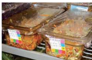
Klare Kennzeichnung aller Produkte